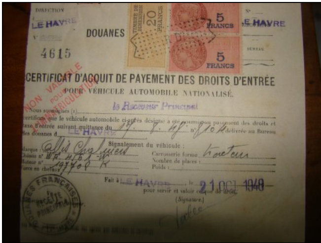
Certificat des douanes du port du Havre pour le tracteur américain « Allis Charmers » de la CUMA de Réparsac du 21 Octobre 1948

Dès le 22 août 1948, le conseil d'administration fixe le règlement intérieur de la CUMA (Coopérative d'Utilisation de Matériel en Commun) :