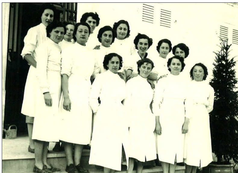
Elles travaillaient à « Grand'Ouche » (1951) :