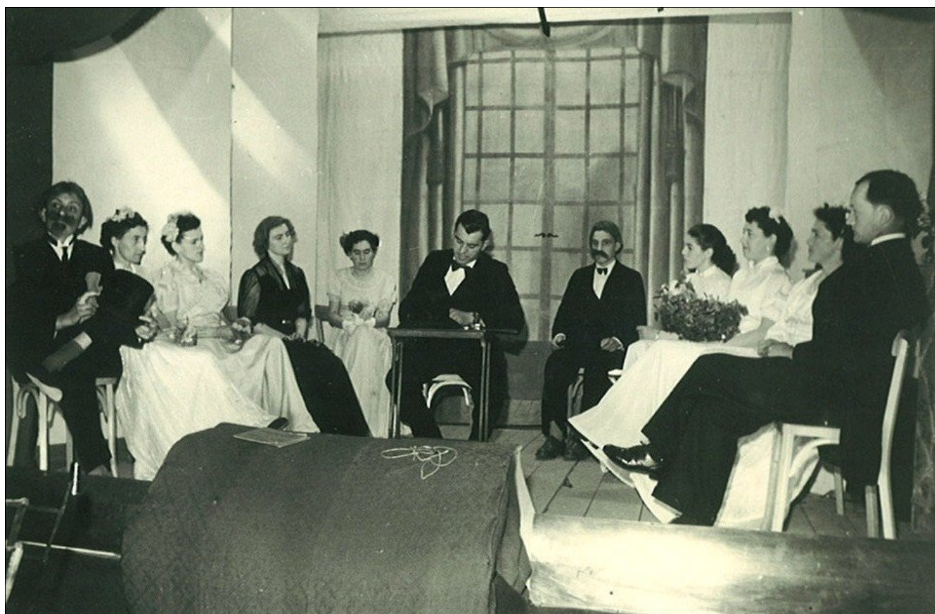
Mars 1953 : 20ème anniversaire de la « Grand'Ouche » Théâtre (dans la laiterie) par les jeunes de Réparsac